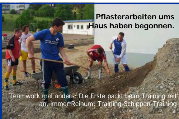
Pflasterarbeiten ums Haus haben begonnen.